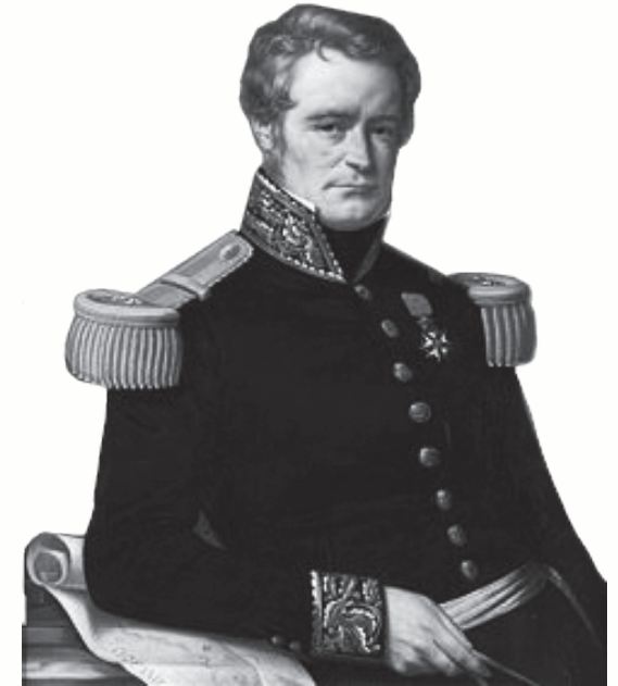
Jules Dumont d'Urville (1790 – 1842)

Marea a început să se mărească, valurile au crescut în înălțime de la o clipă la alta, iar corabia era agitată în sus și în jos ca și cum un uriaș o ținea într-un bazin și se bucura să o lege. Valurile se împingeau unele pe altele, ca și cum fiecare își ajuta vecinul să se ridice deasupra sa pentru a ajunge din ce în ce mai sus. Căpitanul privea îngrijorat cum acel spectacol devenea din ce în ce mai amenințător. Valurile i se păreau mâinile mari cu gheare ale unui uriaș care se năpustește cu furie asupra biete sale nave, marea căpătase o culoare densă, întunecată și compactă, urcând și coborând, lovind nava din toate părțile. Se simțea purtat în sus și apoi trântit înapoi în jos și i se părea că odată cu lemnul navei i se prăbușea și inima, dar nu avea timp să se teamă, trebuia să găsească o soluție pentru a încerca să reziste.